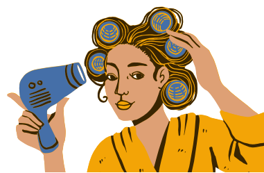
wałki do loków