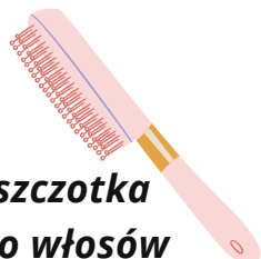
szczotka do włosów