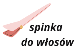
spinka do włosów