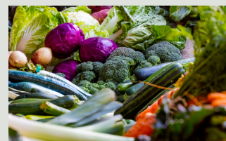
овощи - warzywa