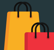
torba, reklamówka, foliówka