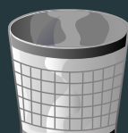
kosz na śmieci